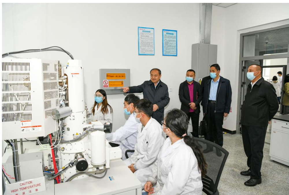
参观新疆大学省部共建碳基能源资源化学与利用国家重点实验室

与会人员还实地参观了新疆大学省部共建碳基能源资源化学与利用国家重点实验室。