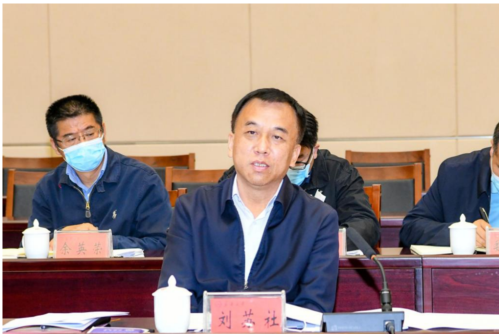
自治区人民政府副主席、党委教育工委副书记刘苏社讲话

新疆中泰（集团）有限责任公司、新疆隆炬新材料有限公司与新疆大学签订了产学研合作战略框架协议，约定中泰集团出资 2000 万元、新疆隆炬出资 600 万元，用于支持新疆大学省部共建碳基能源资源化学与利用国家重点实验室建设，推动双方在煤化工领域、碳纤维领域开展联合攻关，让科研成果尽快转化为生产力，更好地服务自治区优势特色资源高效开发和生态环境可持续发展战略。新疆大学为 6 名校外企业科技人员颁发联合培养硕士研究生兼职指导教师聘书，为实现校企合作可持续发展提供有力保障。